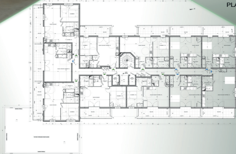
PLAN MASSE MARCHÉ