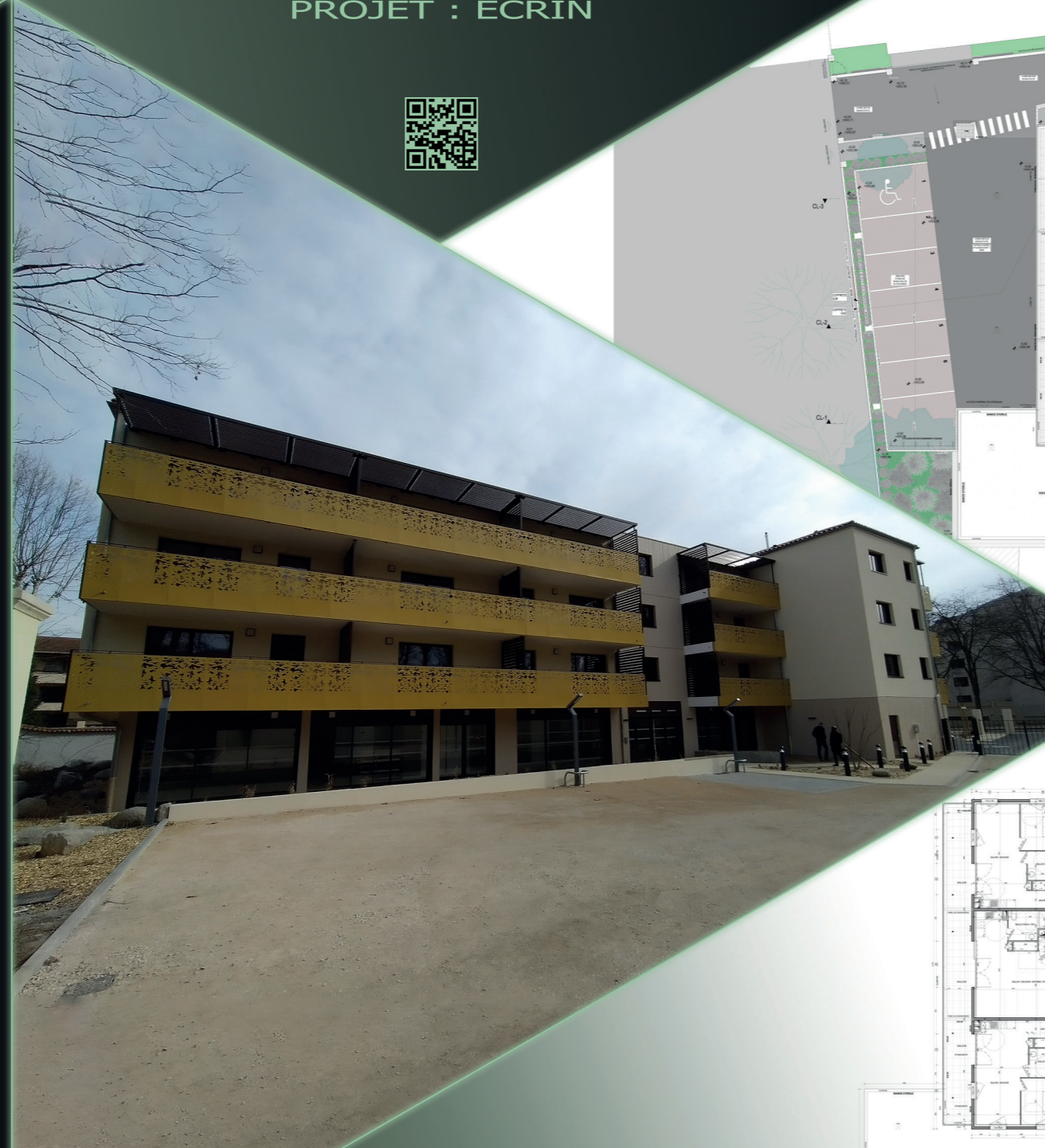
PHOTOGRAPHIE SUR ESPACE COMMUN

La maquette numérique «Bim » de ce projet et ses plans furent construits et représentés avec le logiciel ARCHI-CAD. Le rendu à été réalisé avec le logiciel bim-motion