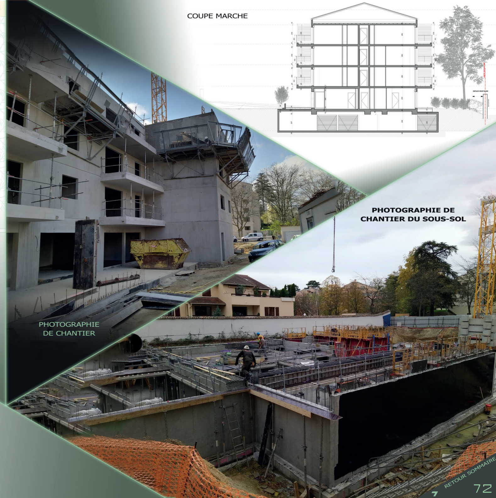
PHOTOGRAPHIE DE CHANTIER